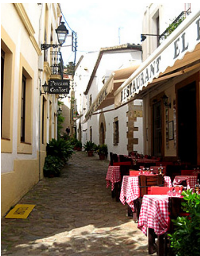
Dagsprogram: se Lloret de Mar

Nedanför gamla "villa vella" ligger dagens by med en strandpromenad där strandrestaurangerna avlöser varandra och ett mysigt centrum med väldigt bra shopping. De många butikerna ligger längs slingrande smala gränder. Byn kallas för "Costa Bravas pärla" och vi är övertygade att alla som besöker Tossa håller med. Vi bor på komfortabla och strandnära ****Hotel Tossa Beach/Tossa Center med all inclusive . Det går buss från Tossa, både om man vill söderut till Barcelona och norrut till Girona.